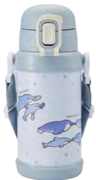
本体柄：ペンギンとイルカ 型番：RYI-KS60BL 上代：¥2,800