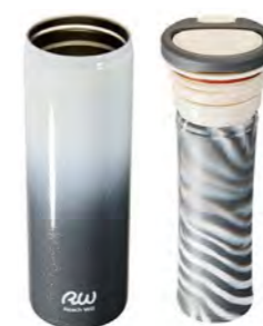
本体 ケースユニット