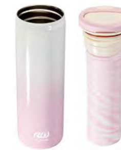
本体 ケースユニット