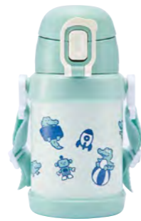
本体柄：ころころワニ 型番：RKSG-45BE 上代：¥2,800