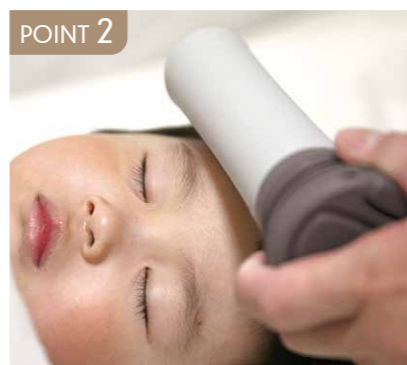
POINT 2 保冷力を保ち発熱や熱中症対策に