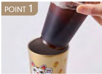
POINT 1 ステンレス製、真空二重構造。