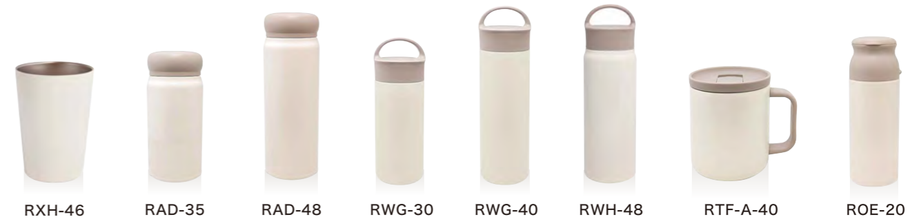
RXH-46 RAD-35 RAD-48 RWG-30 RWG-40 RWH-48 RTF-A-40 ROE-20 RBB-32 RJD-35 RJD-48 REC-35 REC-48 RSF-30 RSF-40 RKSG-45 RKD-60 RKE-80