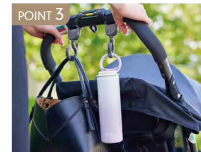
POINT 3 持ち手付きで携帯しやすい。