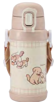
本体柄：イヌとネコ 型番：RYI-KS60IV 上代：¥2,800