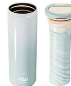
本体 ケースユニット