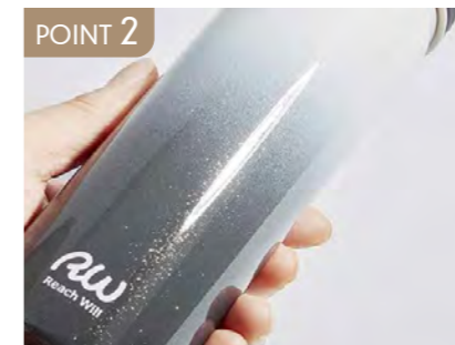
POINT 2 高級感のある上品なこだわりデザイン。