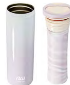
本体 ケースユニット