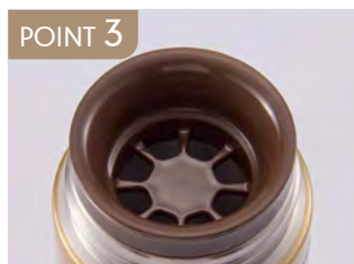
POINT 3 口あたりがやさしい樹脂製の飲み口