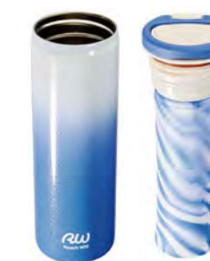
本体 ケースユニット