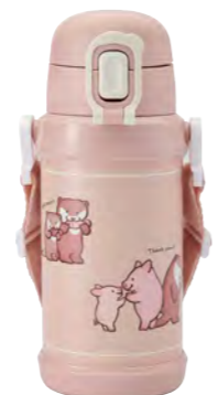
本体柄：カワウソとコブタ 型番：RYI-KS60PK 上代：¥2,800