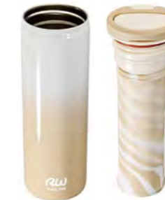
本体 ケースユニット