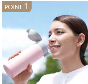
POINT 1 片手で簡単ワンタッチオープン。