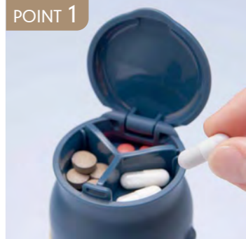
POINT 1 3つの仕切りでサプリメントや、薬を入れられます。