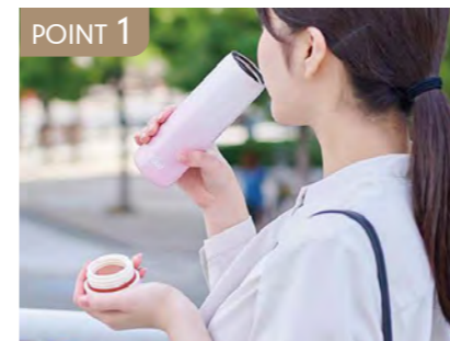
POINT 1 氷のうとステンレスボトルの2WAY仕様。