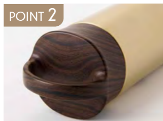
POINT 2 転びにくい形状設計