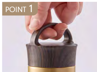
POINT 1 持ち運びしやすい持ち手付き