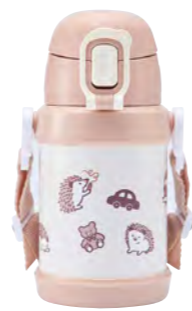
本体柄：くるくるハリネズミ 型番：RKSG-45BE 上代：¥2,800