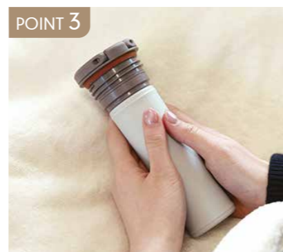
POINT 3 保温力を保ちお湯を入れてポカポカ