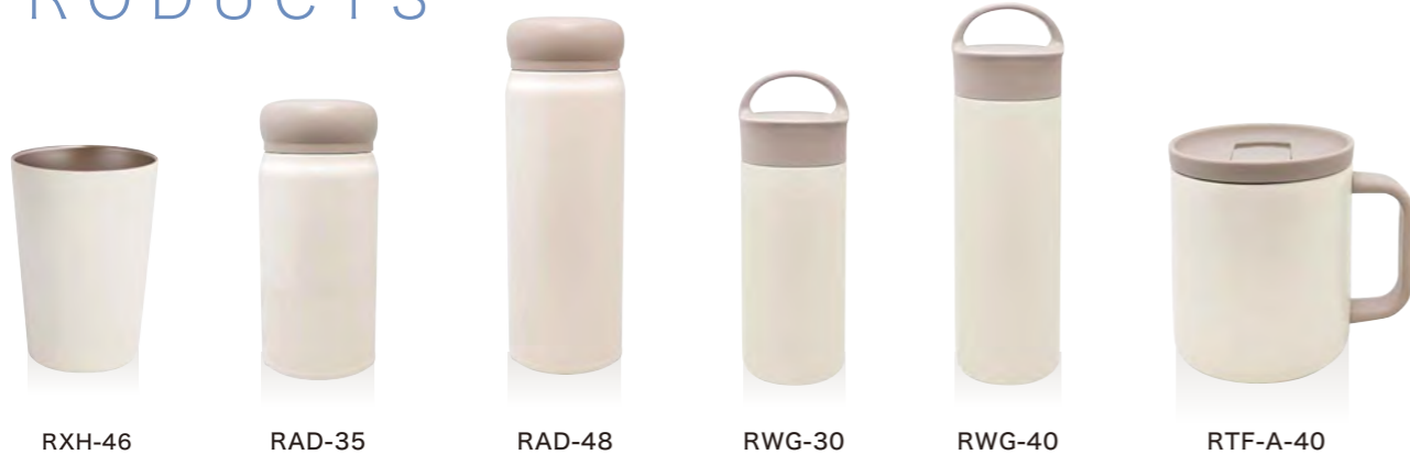
RXH-46 RAD-35 RAD-48 RWG-30 RWG-40 RTF-A-40