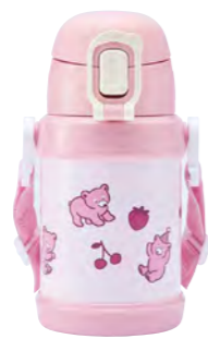
本体柄：ぶかぶかクマ 型番：RKSG-45PK 上代：¥2,800