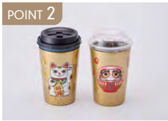
POINT 2 カップをインして、保温・保冷力を保つ。