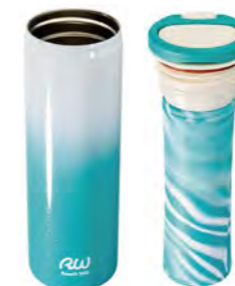
本体 ケースユニット