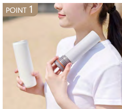
POINT 1 携帯しやすくすぐにひんやり冷感